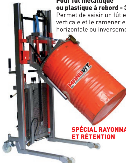
SPÉCIAL RAYONNAGE ET RÉTENTION

Permet de saisir un fût en position verticale et le ramener en position horizontale ou inversement.