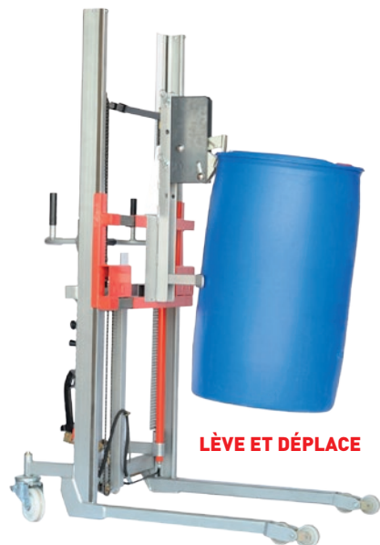
LÈVE ET DÉPLACE

Permet de saisir, lever et déplacer un fût métallique ou plastique à rebord ou à ouverture totale.