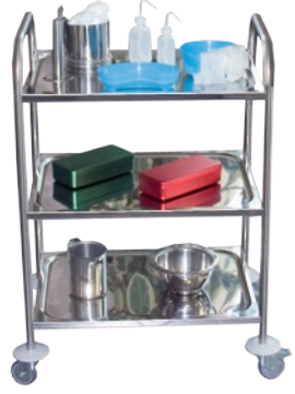
Desserte 60 kg - INOX 304

Autres types de roues disponibles sur demande.