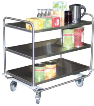
Chariot à plateaux 200 kg INOX 304

9968856054 Roues caoutchouc antistatique non tachant 2 fixes + 2 pivotantes à frein. Dim. plateau : 800 x 500 mm. Existe en version 3 plateaux.