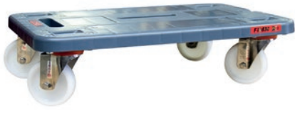
Plateau roulant 500 kg

9968657657 Excellent auxiliaire de manutention pour tous types de charges. Roues nylon montées avec chape et visserie INOX. Plateau 600 x 400 mm en polypropylène renforcé, épaisseur 30 mm. Existe en version polypropylène renforcé avec rebords pour manipulation de bacs 600 x 400 mm.