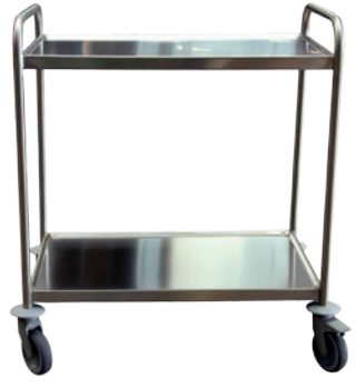
Chariot à plateaux 120 kg INOX 304

9968856054 Roues caoutchouc antistatique non tachant 2 fixes + 2 pivotantes à frein. Dim. plateau : 800 x 500 mm. Existe en version 3 plateaux.