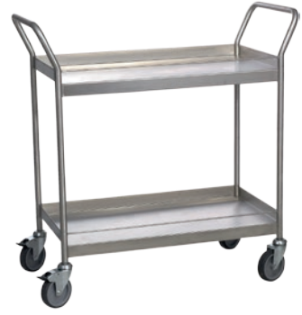
Chariot à plateaux 300 kg INOX 304

9968856693 Roues caoutchouc antistatique non tachant 2 fixes + 2 pivotantes à frein. Dim. plateau : 1000 x 600 mm. Existe en version 2 plateaux.